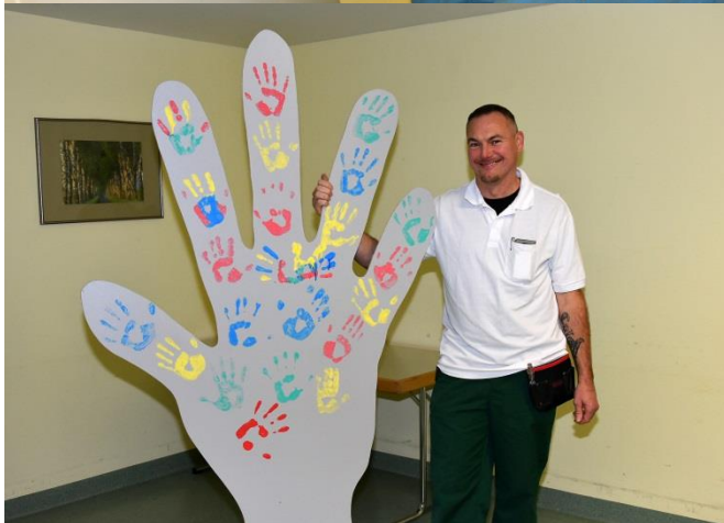
Hauseigener Tischler stellte diese Hand her