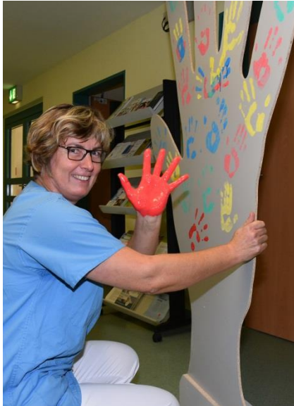
Handabdruck auf der Holzhand

Wissensabfrage zu „aseptischen Tätigkeiten“